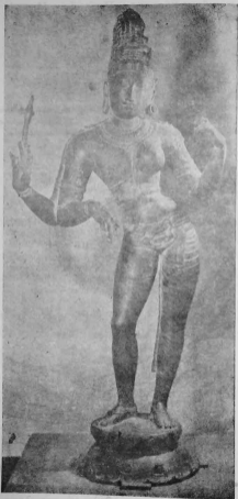
பெண் கர்த்தும் உருவாகல்; திருமெய்க்காடு; தஞ்சை மாவட்டம்; இராஜராஜன் காலம்; கி.பி. 11-ஆம் நூற்றாண்டு