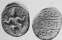
படம் 2. கருடன்-சமரகோலாகவன் என்றும் பெயர்.