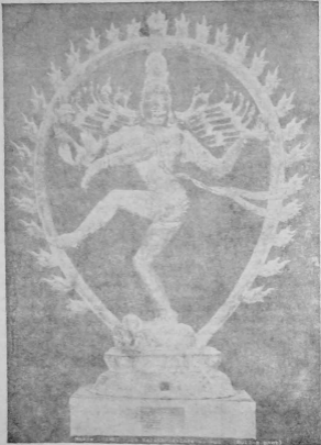
பாரிஸ் மாநகர மீதுள்ளிருந்து எண்ணம் காட்டுகையில் உள்ள ஆடவன்மாதம் திருமேனி இ. பி. 11-ஆம் நூற்றாண்டு.