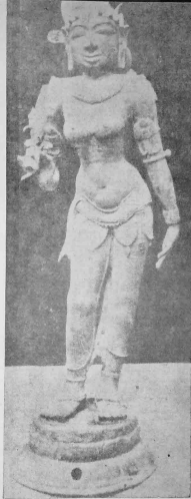
சோழ மரபின் செப்புத் திருமணி: இராஜேந்திர சோழன் காலம் இ. பி. 11-ஆம் நூற்றாண்டு