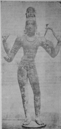
கிண்தரர்: தருணாக் கல்க்கட்டம்: ஸற்காஸல் சோழர் காலம்: இ. 13. 10-ஆம் தூற்றும்